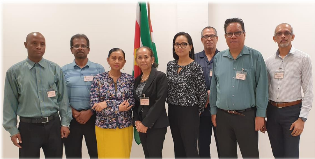
Op de foto: De Anti-corruptie Commissie en de Procureur-Generaal)