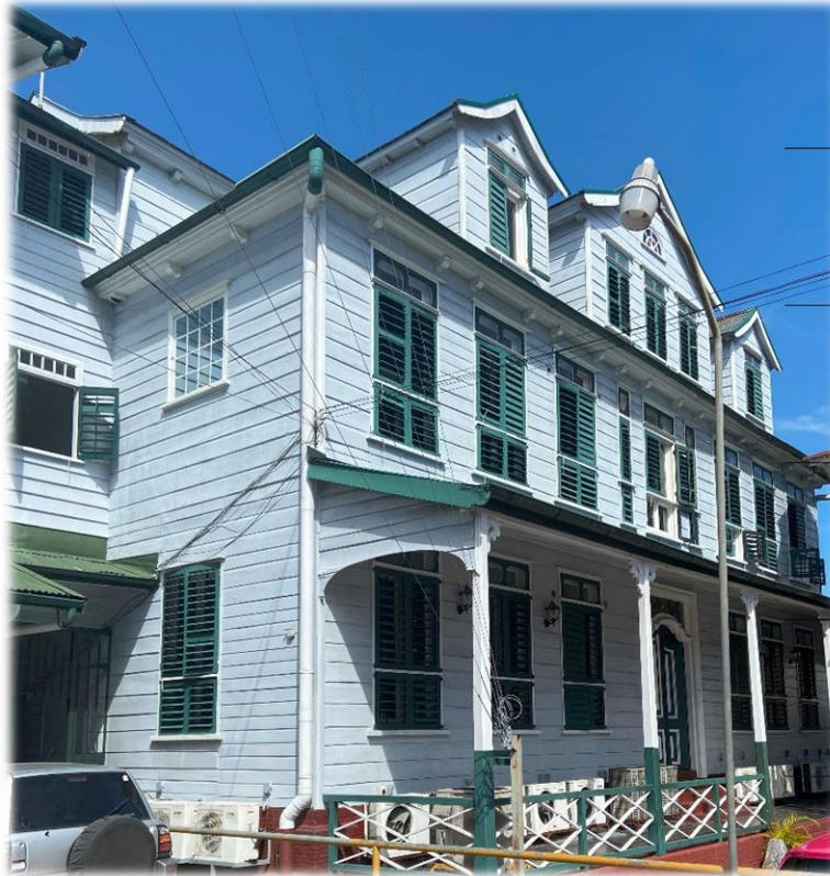
Foto: Kantoor Anti-corruptie Commissie - achterzijde