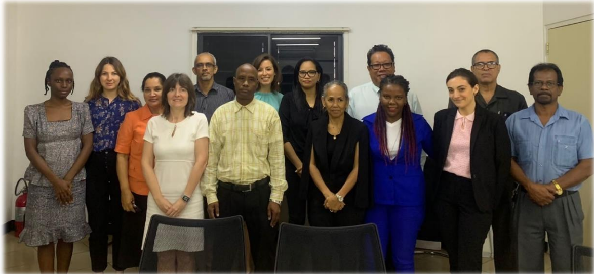
(Op de foto: Anti-corruptie Commissie, Franse Delegatie van de AFA, medewerkers van Ministerie van Justitie en Politie)