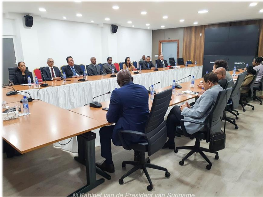
Foto: Installatie van de Anti-corruptie Commissie op het Kabinet van de President van Suriname

In het jaar 2017 is de “Wet van 24 september 2017, houdende regels inzake preventie en bestrijding van corruptie en instelling van een Anti-corruptie Commissie, alsmede wijziging van het Wetboek van Strafrecht en het Decreet Uitgifte Domeingrond Anti-corruptiewet”, aangehaald als de Anti-corruptiewet, afgekondigd. In deze wet staat beschreven aan welke eisen de Anti-corruptie Commissie moet voldoen om geïnstalleerd te worden en haar werk naar behoren te kunnen doen. Op vrijdag 05 mei 2023 is deze Anti-corruptie Commissie, bestaande uit zeven (7) leden officieel door de President van de Republiek Suriname, Chandrikapersad Santokhi geïnstalleerd.