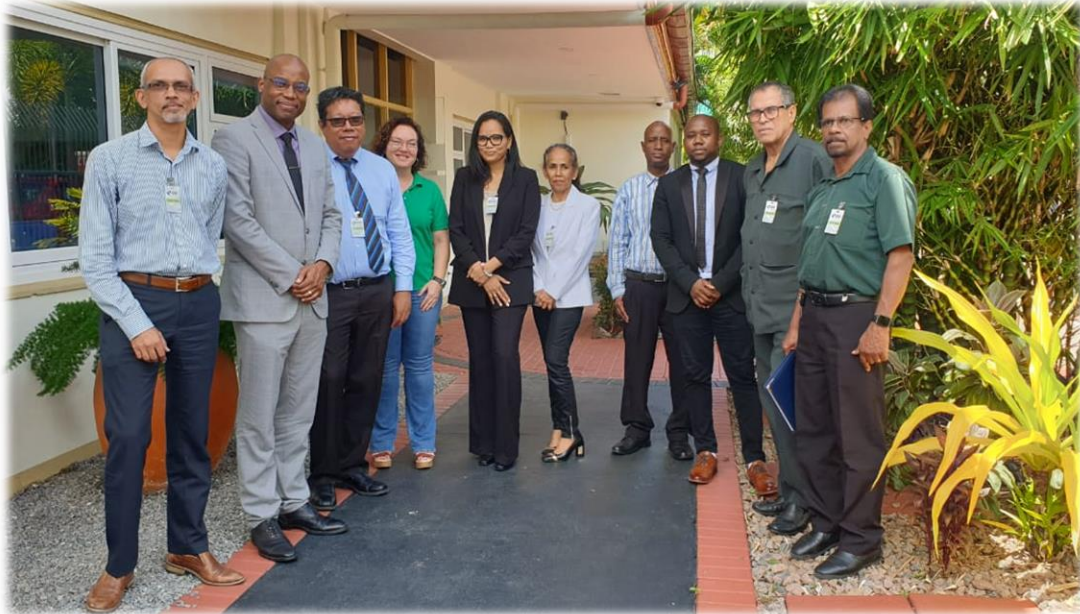
Foto van: Leden van de Anti-corruptie Commissie en leden van de Inter-American Development Bank (IDB)